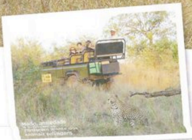
Medo, ansiedade e adrenalina são os ingredientes principais para a aventura de safári.

As leões vigiam a caça enquanto os filhotes aproveitam o banho de sol