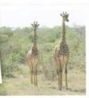
A vida selvagem lado a lado com os visitantes: onça pintada e girafas fazem parte da paisagem e encantam pela proximidade

rapidamente. "Parece que a caçada está suspensa" diz Donald. De volta ao lodge, é hora de aproveitar a piscina, fazer uma massagem, caminhar ou só descansar no deck com vista privilegiada para o rio que corta a reserva. Os dias e as noites nos safáris são pura adrenalina, emoção e romantismo. As noites claras, o céu repleto de estrelas, o silêncio, o frio, as tochas e as velas acesas: tudo é coverite para se apaixonar - ou se reapaixonar . Não vi os flamingos e não sobrevoei a savana a bordo de plano, mas quando o avião que me levaria embora voou, as imagens vieram como um filme e não destruam de me apaixonar .